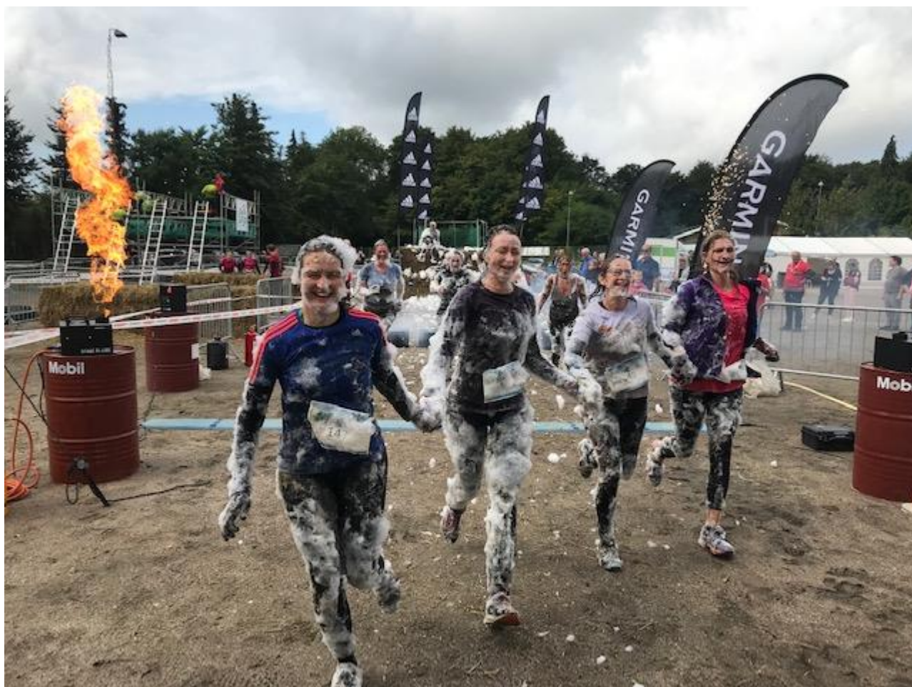
Glade Mud-ladies i skum ved årets Ladies Mud Race